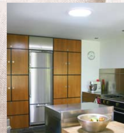
Zeer fraaie keuken met Solatube daglicht in Heerwaarden (NL).

Het optimaal benutten van daglicht vereist hoogwaardig materiaal en uitgekende technieken. Solatube heeft deze technieken ontwikkeld en gepatenteerd. Solatube levert al ruim 20 jaar daglichtbuizen. Wereldwijd zijn meer dan 2.000.000 systemen geïnstalleerd. Daarom kunt u op Solatube vertrouwen.