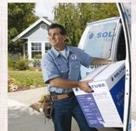
Plaatsing gaat snel en eenvoudig, de Solatube-systemen zijn leverbaar voor alle soorten platdak én alle pannendaken.